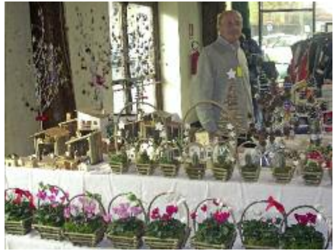
Artigianato in legno