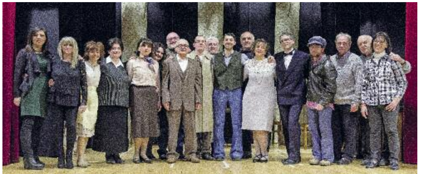
Filodrammatica "Il Ribaltino"