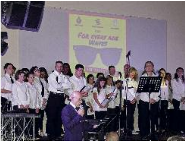
Cori: "For Ivery Age" e "WAles"