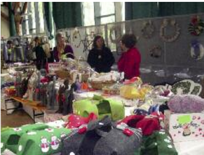
Lavori confezionati a mano