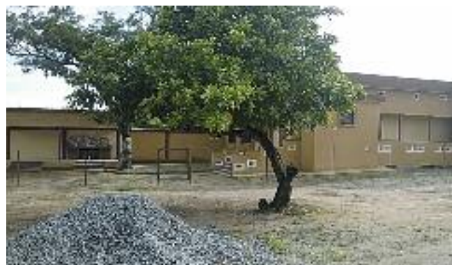
Sullo sfondo il laboratorio