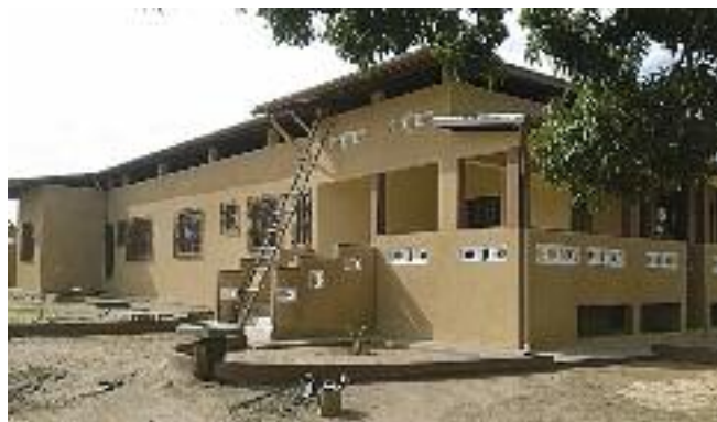
La casa delle suore